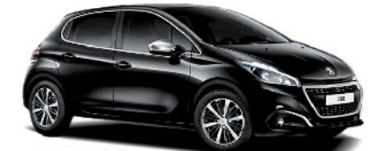
Noir Perla Negra